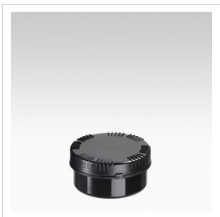
Банка 300 мл Раско, черная, устойчивая к УФ-излучению

Цвет банки - белый Артикул №: 4325-70-004