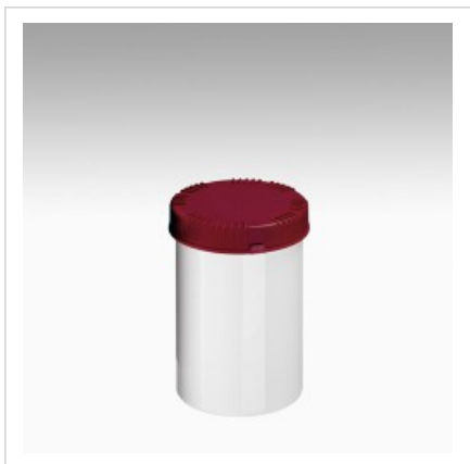
Банка 1000мл Раско, белая

Цвет банки - белый Артикул №: 4310-70-004