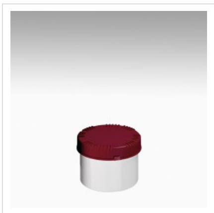
Банка 500мл Раско, белая

Цвет банки - белый Артикул №: 4303-70-004