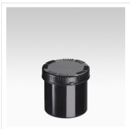
Банка 650 мл Раско, черная, устойчивая к УФ-излучению

Цвет банки - черный Артикул №: 4305-70-101