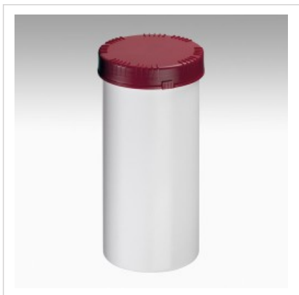
Банка 2500мл Раско, белая

Цвет банки - белый Артикул №: 4325-70-004