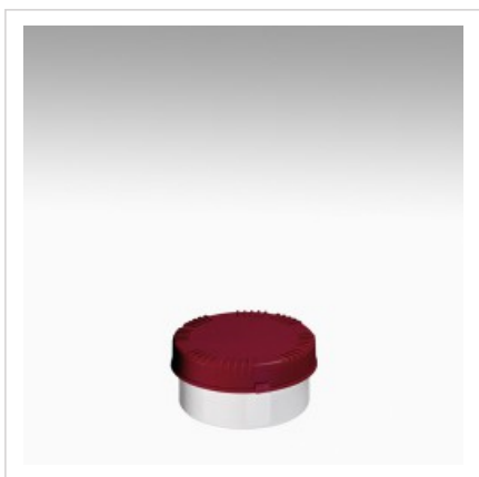
Банка 300мл Раско, белая

Цвет банки - белый Артикул №: 4303-70-004