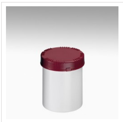
Банка 1500мл Раско, белая

Цвет банки - белый Артикул №: 4313-70-004