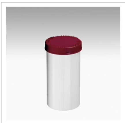
Банка 1300мл Раско, белая

Цвет банки - белый Артикул №: 4310-70-004