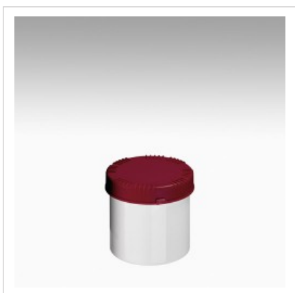
Банка 650мл Раско, белая

Цвет банки - белый Артикул №: 4305-70-004