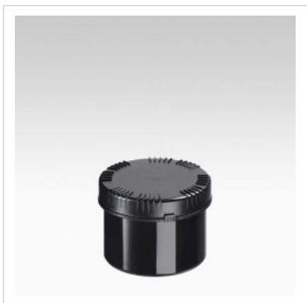
Банка 500 мл Раско, черная, устойчивая к УФ-излучению

Цвет банки - черный Артикул №: 4303-70-101